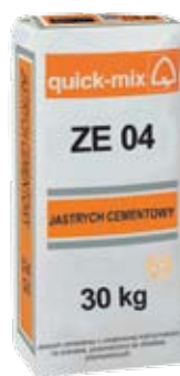
Jastrych cementowy – ZE 04