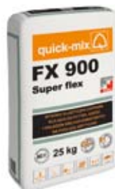
Wysoko elastyczna zaprawa klejąca (do płytek, gresu i okładzin wielkoformatowych na podłoża krytyczne) – FX 900 Super Flex