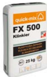
Elastyczna zaprawa klejąca do klinkieru – FX 500 Klinkier