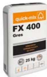
Wzmocniona zaprawa klejąca do gresu – FX 400 Gres