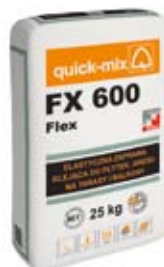
Elastyczna zaprawa klejąca (do płytek, gresu na tarasy i balkony) – FX 600 Flex